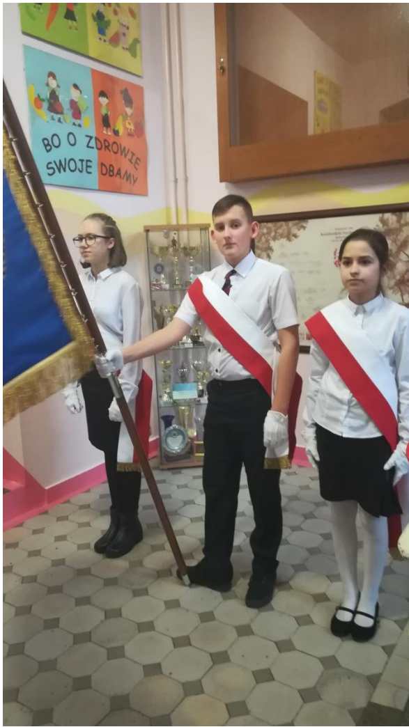
(zdj.7) Postawa „prezentuj”