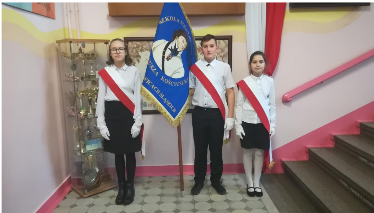
(zdj.3) Postawa „zasadnicza” – bacność