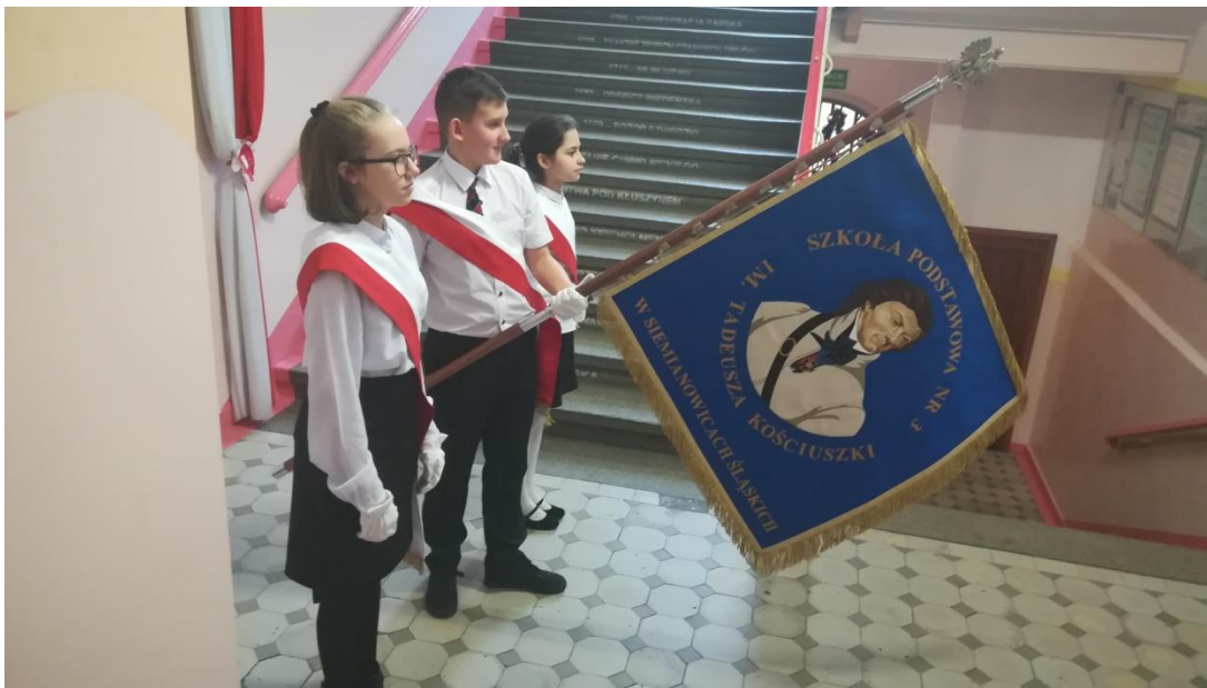
(zdj.8) Salutowanie w miejscu