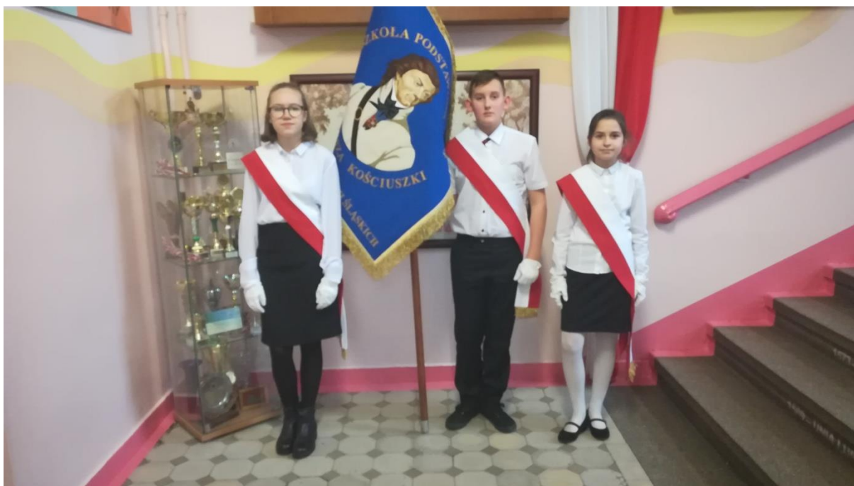
(zdj.4) Postawa „swobodna” – spoczni