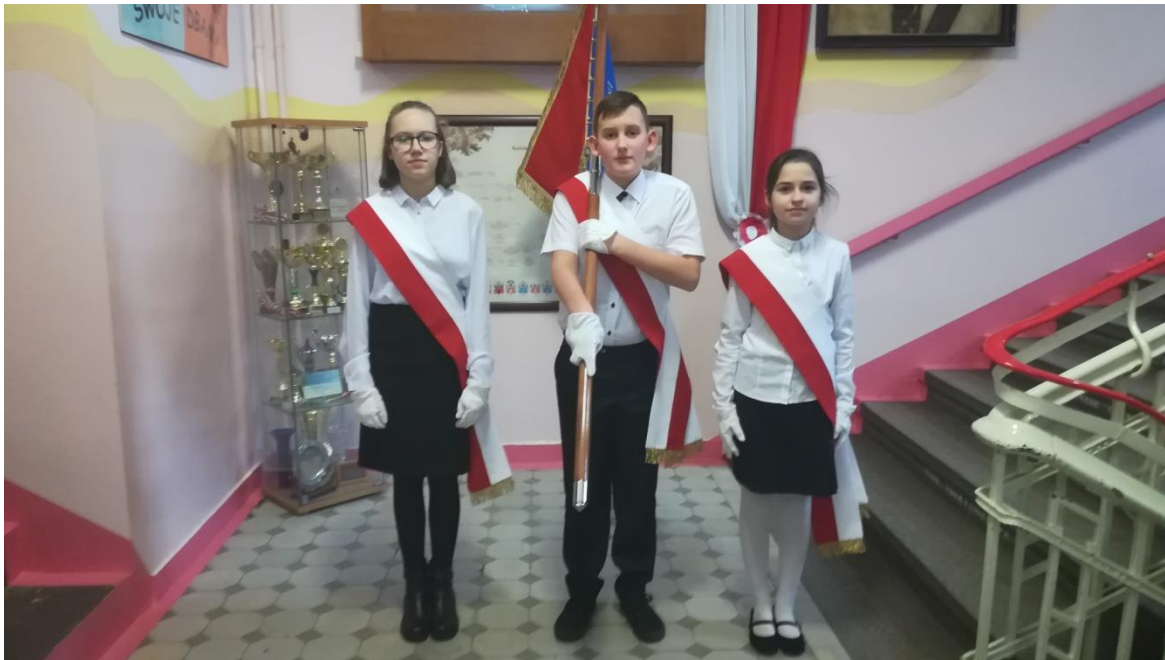
(zdj.5) Postawa „na ramię”