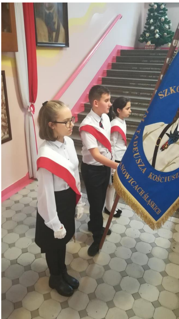
(zdj.6) Postawa „prezentuj”